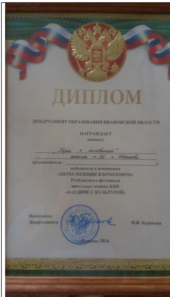
Учащиеся играют в КВН,