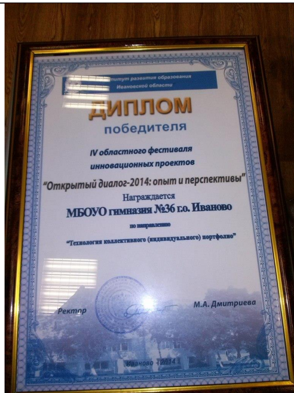
И представляют свой опыт на региональном уровне