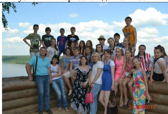
Регулярно организуются экскурсионные поездки совместно с родителями, музейные уроки, театральные часы