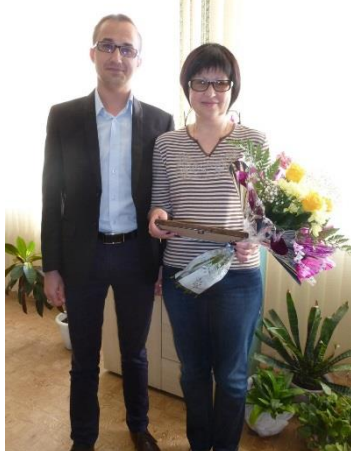
Выпускники возвращаются в школу работать и не забывают поощрять своих учителей