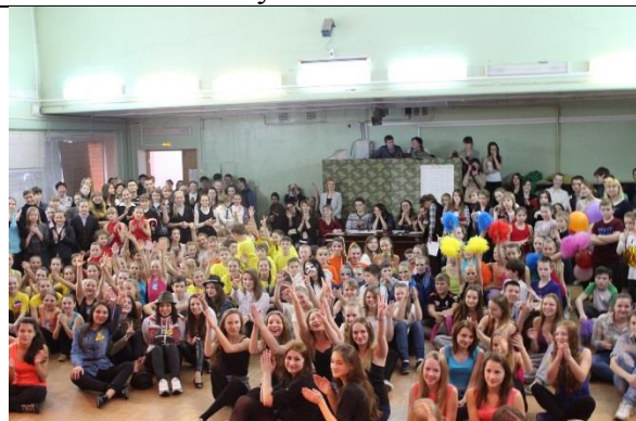
На школьных мероприятиях всегда аншлаг