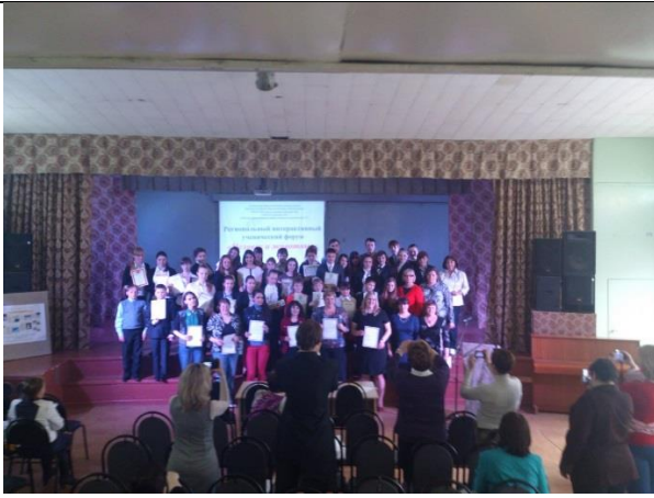
Школьные проекты выходят на региональный уровень (Форум «Человек и животные»)