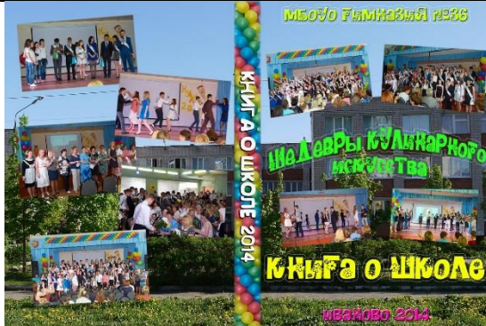
Выпускники ежегодно создают книгу о школе