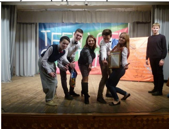
Учащиеся побеждают в городских и региональных творческих конкурсах