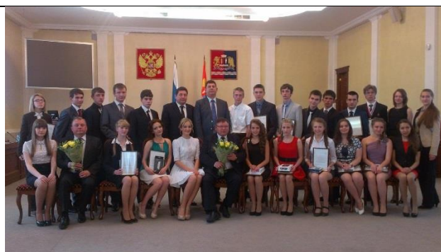
Учащиеся достигают высоких результатов в интеллектуальной и лидерской деятельности