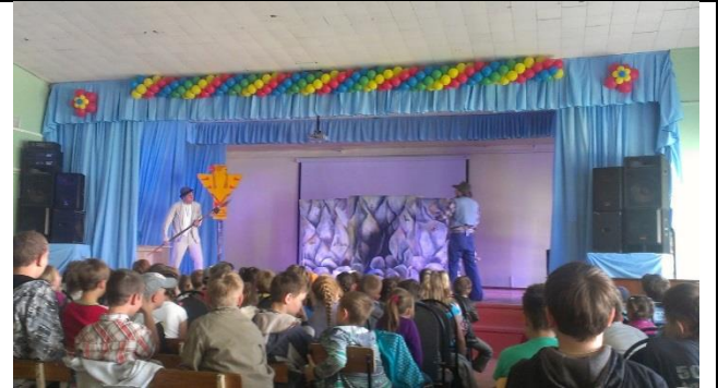
Родители – активные участники школьной самодеятельности