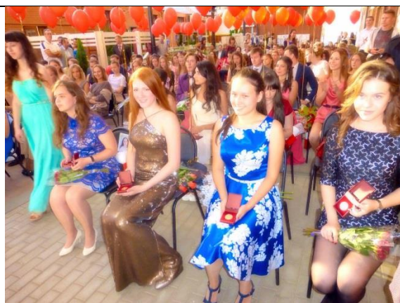
Ежегодно выпускники становятся обладателями премий за отличную учебу и успехи в творческой деятельности