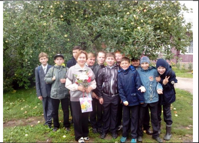
Учащиеся взяли шефство над ветеранами пед.группы