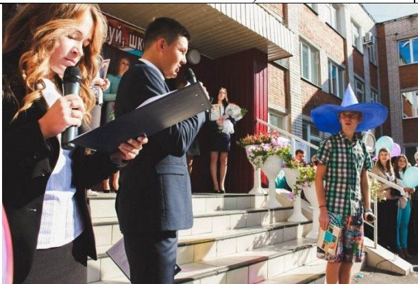
Проводят инсценированные представления для младших школьников