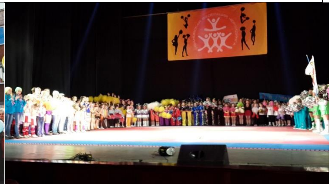
Участвуют в мероприятиях города и области