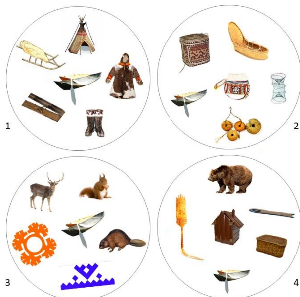
Рис. 2 Фрагмент карточек игры «Дубль» «Что я знаю о Югре?»